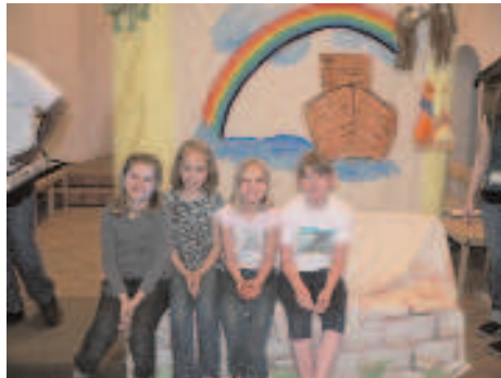
Musical-Aufführung „Noah“ beim Sommerfest

Zur Erleichterung unserer Vorbereitungen bitten wir Euch, uns unter Angabe der Personenzahl (Erwachsene und Kinder) mitzuteilen, ob Ihr zum Mittagessen bleibt – entweder telefonisch unter 711 20 71 (wochentags 10 – 12 Uhr) oder zu den Büro-