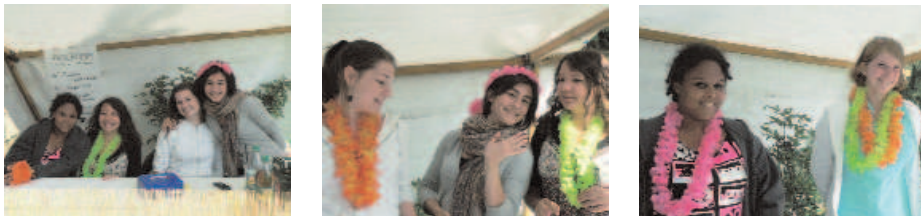
Die Teamerinnen beim Sommerfest