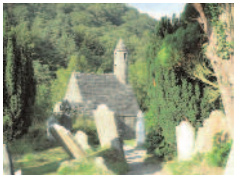
Mittelalterlicher Friedhof in Irland

Vorträge informieren über die Vorsorge für das Lebensende (11.00 Uhr und 14.00 Uhr); die Deutsche Kriegsgräberfürsorge e.V. präsentiert einen Film über den Friedhof „Auf dem Golm“ – Begräbnisstätte für 18.000 Tote des Luftangriffs auf Swinemünde (10.30 Uhr und 16.00 Uhr) und der Kirchenkreis Tempelhof veranstaltet Lesun-