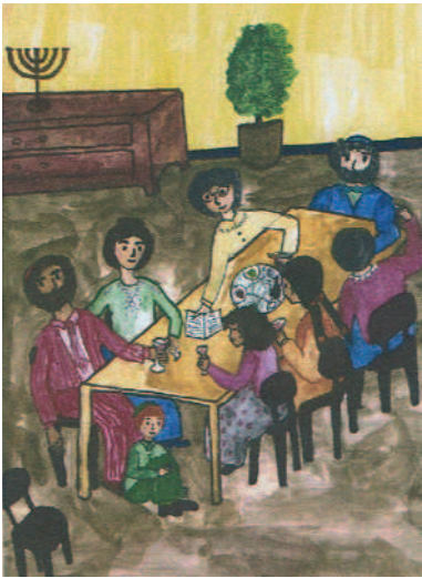
Passahmahl in einer jüdischen Familie (Kinderzeichnung)

So wie Gottes Erlösungswerk in Ägypten in der Mitte der Passahnacht begann, so wird sein Erlösungswerk mit seinem Messias auch irgendwann in einer Passahnacht beginnen, glauben fromme Juden. Dafür steht auf dem Sedertisch der Elias-Becher gefüllt mit Wein, aus dem nicht getrunken wird. Elia symbolisiert den kommenden Messias, der zur bleibenden Hoffnung auf den Tag der Erlösung Gottes wird.