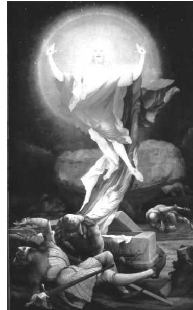
Matthias Grünewald, Auferstehung (Isenheimer Altar)

Was bleibt uns übrig, als die Bilder zu verwenden in dem Bewusstsein, dass es