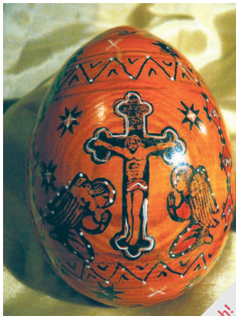
Matruschka-Osterei (s. S. 10)

Bitte beteiligen Sie sich! Volksbegehren 26. April 2009 „Pro Reli“