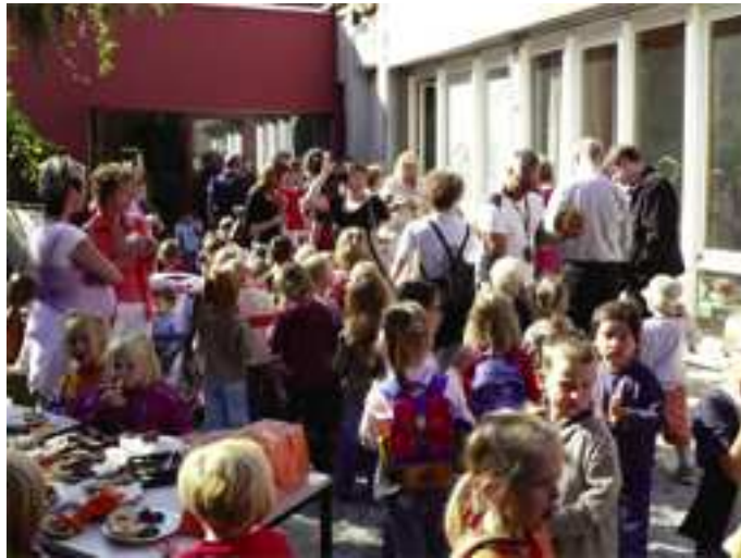
Fensterwand von außen bei der Einweihung der Kita, September 2006

Jahren die klotzige Holzgerahmte Fensterkonstruktion aus der Bauzeit des Gebäudes (1974) durch eine elegantere aus Stahlprofilen ersetzt. Und die Glaskünstlerin Frau Marie-Luise Dähne gestaltete für uns eine Altarwand, an der sich durch die Verschiebung der großen blauen und grünen „Glasvorhänge“ spannende Effekte erzeugen und die eigentliche Mitte wunderbar zur Geltung kommen lassen.