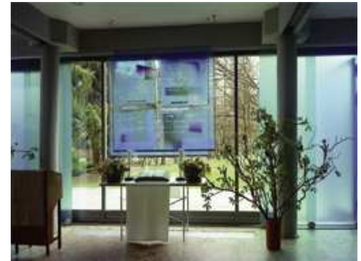
Fensterwand mit provisorischem Altar 2009–2011 (hier mit Osterschmuck)

Dorothee-Sölle-Haus überall sehen, grob verarbeitet und mit sichtbaren Abdrücken der Schalung. Wir bestaunten anhand von Proben, die die Künstlerin uns zeigte, die feine und künstlerische Art, in der Beton heute in dünnen Platten gegossen werden kann, die aussehen wie hoch polierte Stein tafeln. Dieses hochwertige Material („Betonlith“) wird nun den soliden Unterbau von Altar und Lesepult bilden. Darüber wird, wie eine schützende Hülle, ein Glasmantel konstruiert, der den Stein durchschimmern und das Licht hindurch scheinen lässt. „Inhaltlich betrachtet, ist es ein einfacher Stein, umhüllt von einer gläsernen Membran, der damit zu etwas Kostbarem erhoben wird. Auch hier ist das Thema – Drinnen und Draußen – Materie und Geist – aufgegriffen, um die Gegenwartigkeit dessen zu um-