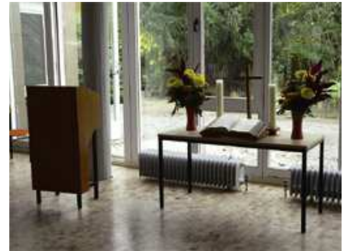
Provisorischer Altar mit alten Fensterprofilen im Hintergrund, 2006

Der Gemeindegemeinderat entschied sich vor drei Jahren für eine andere Übersetzung, die aus der „Bibel in gerechter Sprache“. Er gab damit seinem Wunsch Ausdruck, dass in und über unserem modern konzipierten, flexiblen und dem Alltagsleben der Menschen in seiner Umgebung offen stehenden Haus auch ein für heutige Ohren verständlicher, anspruchsvoller literarischer Text stehen sollte. Lange haben wir hin und her überlegt, auch nicht-biblische Texte in Erwägung gezogen und dann zu diesem gefunden. Er ist eine der wenigen Textstellen der Hebräischen Bibel, in der die Auferstehung anklingt. In der Übersetzung aus dem Jahr 2006 liest er sich so: „Ist Gott zu meiner Rechten, so wanke