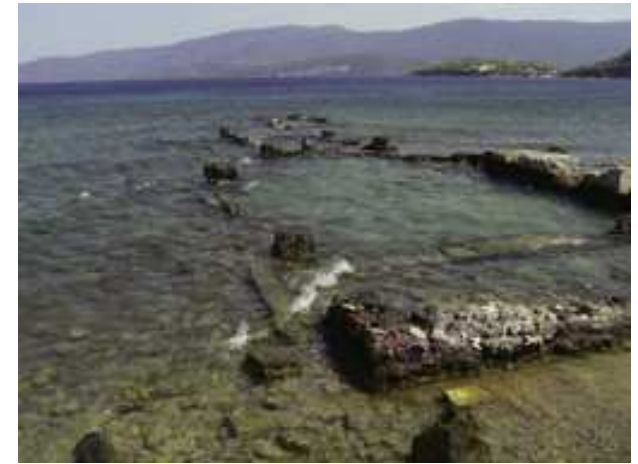
Kenchreä bei Alt-Korinth: Grundmauern von Hafenkai und Kirche, um 400 n. Chr. von einem Erdbeben zerstört

Paulus gab seinen jungen Freunden und Mitarbeitern Timotheus und Titus meine Adresse. Wenn sie etwas nötig hätten nach der Landung oder vor der Abfahrt der Schiffe, sollten sie sich bei mir melden. Titus hat die zerstrittene Gemeinde in Korinth zur großen Freude und Erleichterung für viele wieder einigen können. Dann war Paulus im Winter 55 bis 56 selbst in Korinth. Das war eine gute Zeit der Glaubensstärkung und Wissensvermittlung. Paulus schrieb in dieser Winterzeit viele Briefe, um die jungen Gemeinden überall in der Nähe