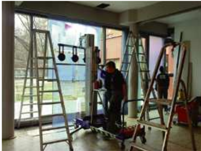
Einbau der Bildfenster-Tafeln im Dezember 2009