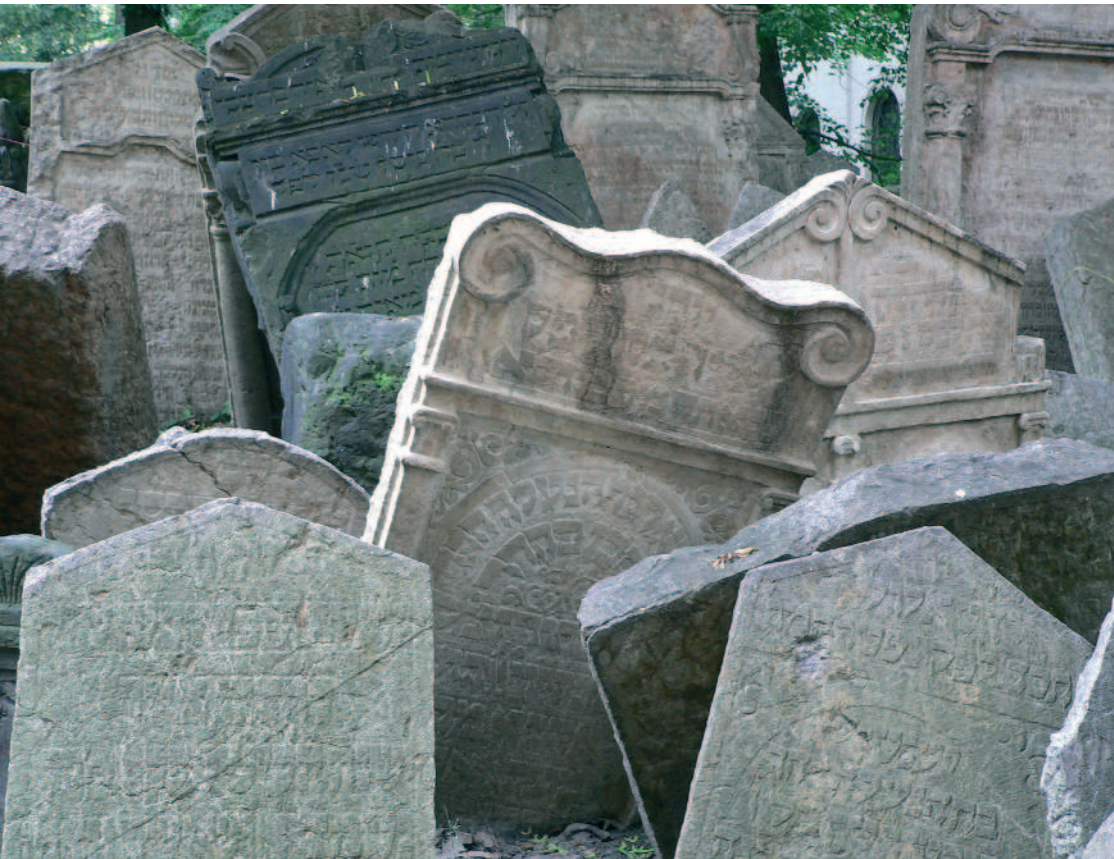
Jüdischer Friedhof in Prag