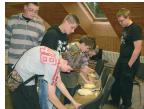
Teighneten für Abendmahlsbrote

Was war diesmal besonders? Das Wetter im Harz ist im Herbst nicht be-