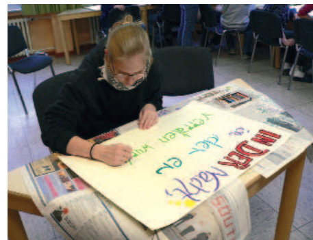
Malen fürs Abendmahl

sonders freundlich, so dass wir wenig draußen sein konnten. Die Feten waren nicht allen Konfis laut genug (ein Tieftöner ging kaputt), wohingegen die Hauptamtlichen die angenehme Lautstärke zu schätzen wussten. Bei der Station zum Thema „Freude“ landete unverhältnismäßig viel Fingerfarbe auf den Wänden des Schullandheims Torfhaus – hoffentlich bemerkt keiner, wieviel wir schrubben mussten. Die Nachtwanderung im Moor war toll und perfekt organisiert (danke an die Teamer, die nachts im Wald gesessen haben) – und nur vier Konfis sind in den Bach getreten! Und: Wir freuen uns, nächstes Jahr wieder nach Plöwen in Meck-Pomm zu fahren, weil die Heimleitung in Torfhaus doch sehr streng und unnachgiebig ist – so dass sogar die Kursleiter morgens zum Frühstück IMMER auf Kritik gefasst sein mussten ... Aber es hat wieder viel Spaß gemacht!