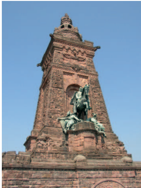
Das Kyffhäuser-Denkmal (erbaut 1890-1896) mit dem Reiterstandbild Kaiser Wilhelms I.

In der Zeit des Nationalsozialismus war der Kyffhäuserbund unerwünscht; 1943 wurde er aufgelöst, sein Vermögen beschlagnahmt und seine sozialen Einrichtungen in die staatlichen Organisationen eingefügt. Erst 1952 konnte der Bund neu gegründet und wieder aufgebaut werden, wurde das durch den Alliierten Kontrollrat beschlagnahmte Vermögen,