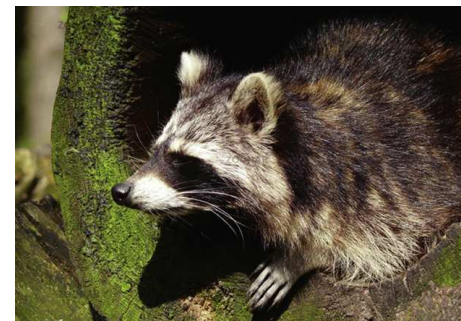
Waldemar hat wirklich überall gesucht