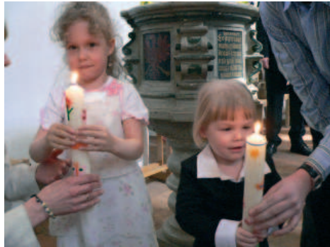
...erinnern ihre Empfängerinnen an den großen Tag.

gen Schöpfungsmotive wie Sonne, Fische, Blumen, Vögel, Regenbogen in unterschiedlichster Weise miteinander verwoben. Jede Kerze ist einmalig und das macht sie so wertvoll.