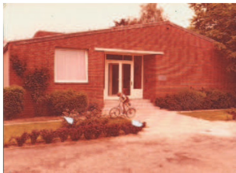
KITA Kirchstraße 1959 bis Juni 1988

Die Grundsteinlegung für die Kita mit 40-45 Plätzen fand 1958 mit Superintendent Birk statt. Der Architekt Emmerich hat-