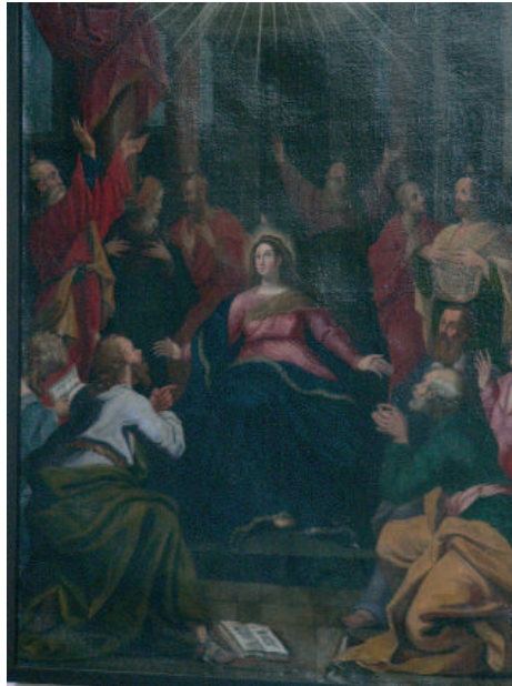
Die Jünger und Maria an Pfingsten (Dorfkirche Marienfelde)

Pfingsten bringt zusammen, was getrennt war. Aufgehoben wird das Sprachengewirr: Wie die Zerstörung des babylonischen Turmes zum Nicht-Verstehen führte, so bewirkt umgekehrt der Geist an Pfingsten, dass Gottes Liebesbotschaft an die Menschen von allen verstanden wird, egal welche Spra-