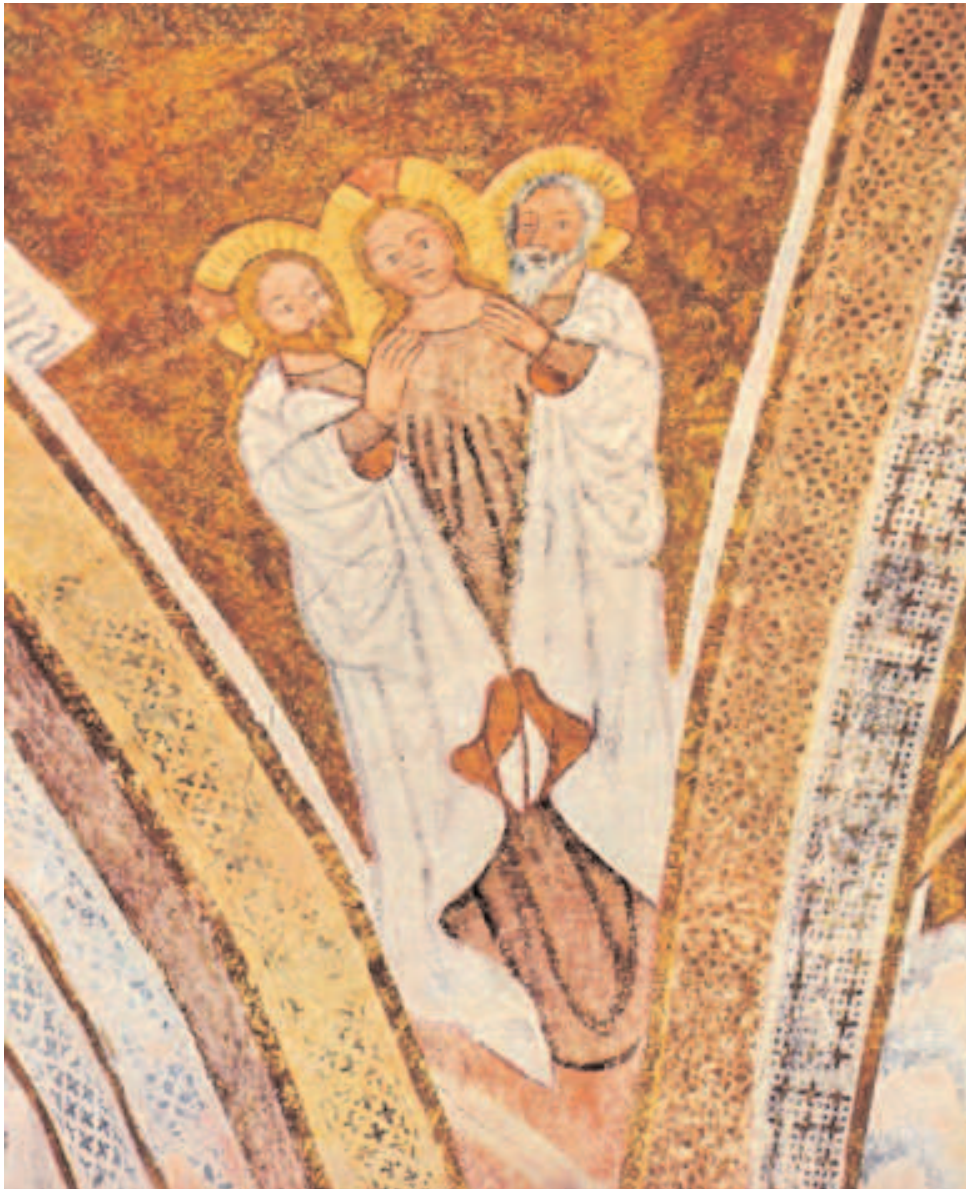
Gott Vater, Sohn und Geistkraft: Darstellung der Dreifaltigkeit, Romanische Kirche von Urschalling (Prien am Chiemsee/Oberbayern)