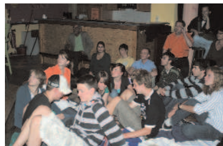
KJK-Veranstaltung im DOWN UNDER