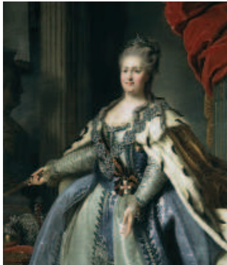
Zarin Katharina von Russland (1729-1796)

1881 Thronbesteigung Alexanders I., Russifizierungskampagne.