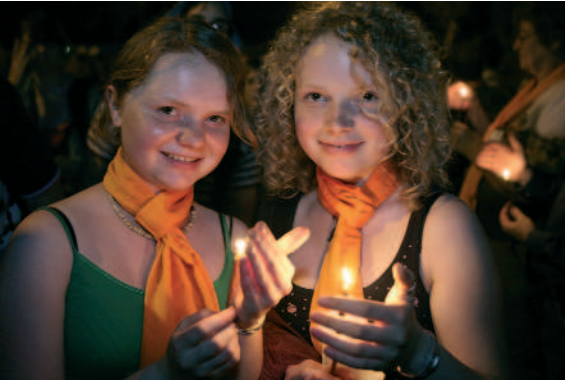
Am „Abend der Begegnung“ beim Kölner Kirchentag