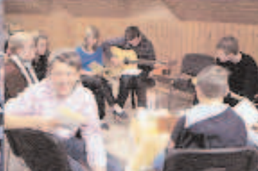
Jahrgang 2008/09 bei der Konferfahrt: Herzliche Segenswünsche zur Konfirmation im Mai 2009