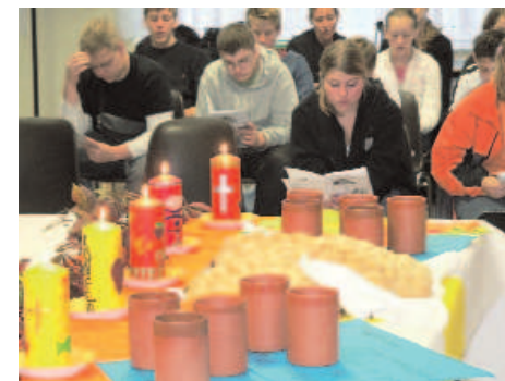
Abendmahl auf der Konferfahrt