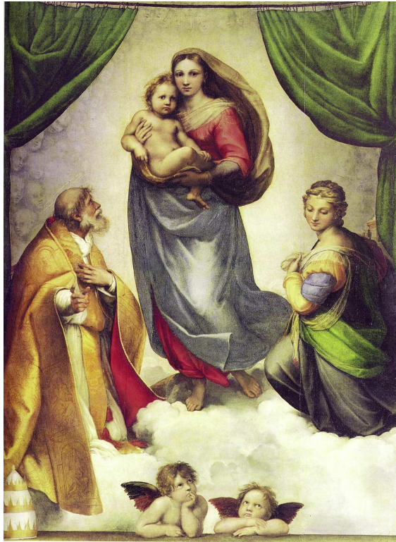
Raffaello Sanzio, gen. Raffael (1483-1520) Sixtinische Madonna, Dresden, Gemäldegalerie Alte Meister

Sie sind sehr früh flügge geworden. Kaum in die Welt gesetzt, begannen sie, ein Eigenleben zu führen, obwohl sie bis heute nicht erwachsen geworden sind. Dabei sind sie inzwischen 500 Jahre alt. Und sie sind einfach nicht tot zu kriegen. Mit ihrem lausbubenhaften, spitzbübischen Wesen verkörpern sie das Unsichtbare und Überirdische in idealtypischer Weise: Sie sind einfach zu süß. Drall und wuschelköpfig, verschmitzt und sinnlich, lümmeln sie da zu Füßen der Madonna, die so ernst und sorgenvoll aus dem Bild schaut wie das Kind, das sie in ihren Armen hält. Ach, Sie wussten gar nicht, dass das Bild noch weiter geht? Na ja, auf den Tassen und Servietten, dem Geschenkpapier und den Konfektdosen ist halt wenig Platz für ‚das große Ganze‘. Und die säkularisierten religiösen Bedürfnisse unserer Alltagskultur befriedigen die niedlichen Knaben so vollständig, dass der ‚Rest‘ sowie so eher stören würde. Im Kampf der Romantik gegen die Moderne siegen letztlich immer beide, und so sind die kessen Jungs mittlerweile ein Vademecum für die wunden Herzen und Seelen ihrer Betrachter. Vor