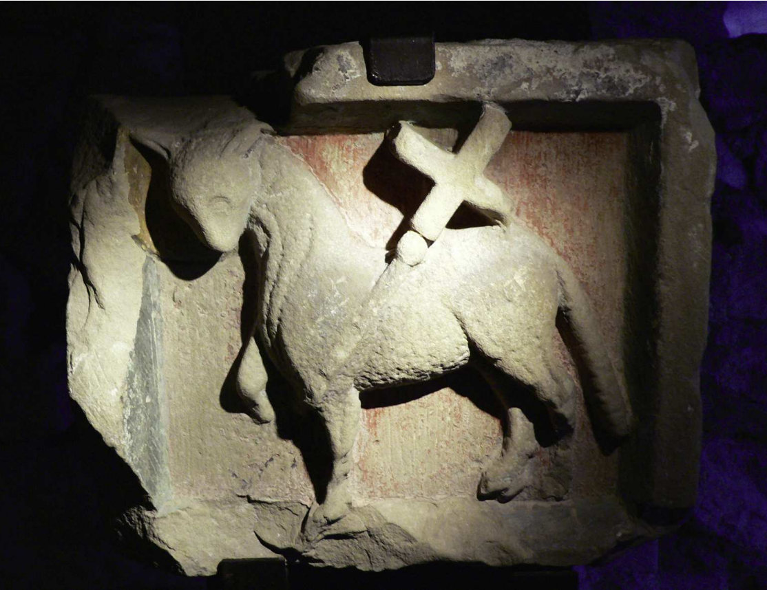
Lamm Gottes, Romanische Darstellung in der Krypta der Wasserkirche in Zürich