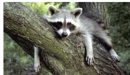
Vielleicht ein Verwandter von Waldemar?

den ein paar Vor-Vor-Vor-Vorfahren von Waldemar hier in Deutschland im Bundesland Hessen ausgesetzt. Und hier bei uns scheint es ihnen wirklich gut gefallen zu haben, denn heute leben ungefähr 250.000 Waschbären in ganz Deutschland verteilt.