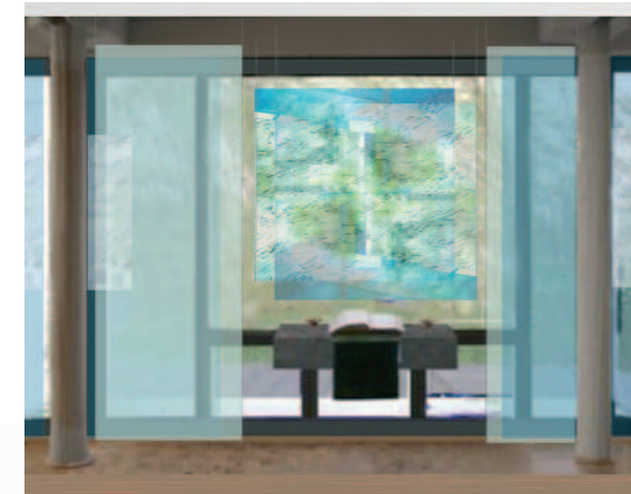
Gestalteter Text für das Mittelfeld der Glaswand über dem Altar

Spendenkonto: KVA Nord-Süd Konto-Nr: 28 013 100 BLZ 100 10010 Auf der Überweisung muss stehen: Mfd – DSH – Kapelle, oder die Nummer der Haushaltsstelle: 1316.00.0312.03.2100