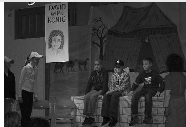
Szene bei der Musical-Aufführung „David, ein echt cooler Held“ des Kinderchors und der Theatergruppe MuT

Gemeindezentrum, freitags 17.00 Uhr Für Kinder ab 6 Jahren (nach Absprache)