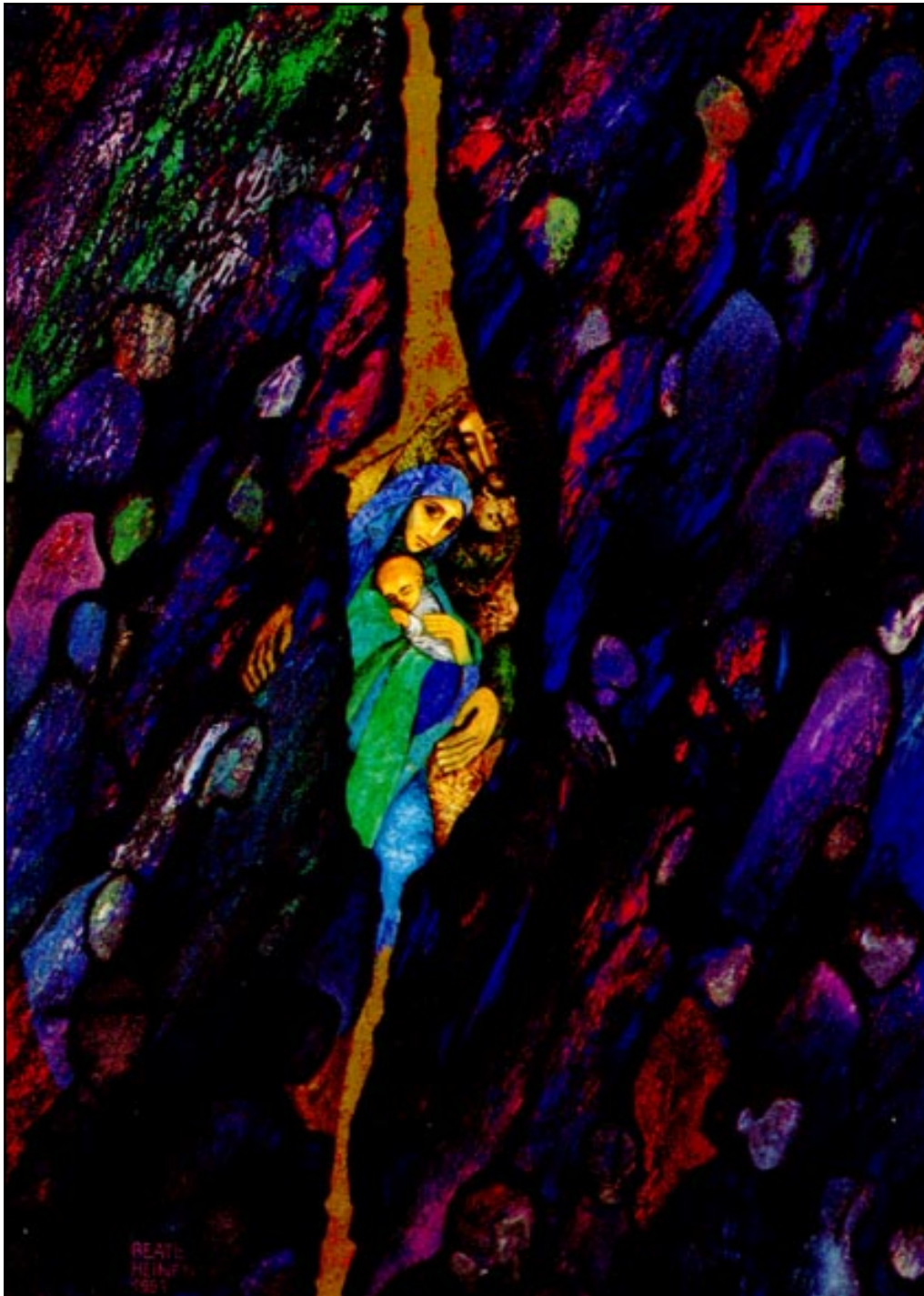
„O Heiland, rei die Himmel auf“ von Beate Heinen, 1993